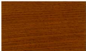
W-06/ダークウォルナット