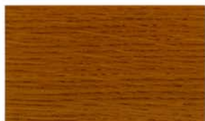
W-14/茶(ダークウォルナット)

汚れの付着を抑え、深みのある風合いと手触り感を出す艶消しワックスです。※床用ではありません。