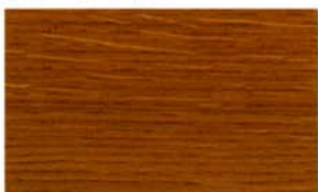
W-13/ダークウォルナット